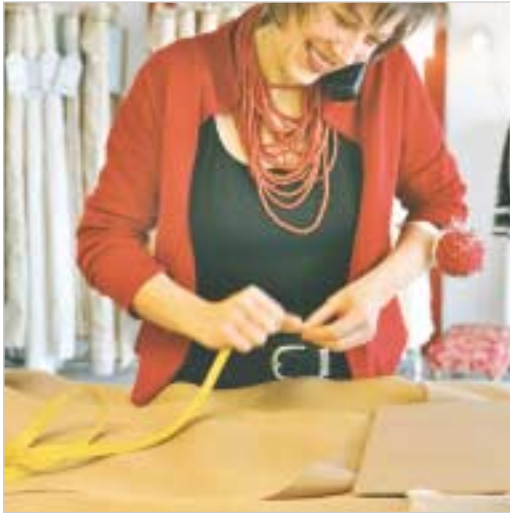
„Die Platte, hochkant oder quadratisch?“